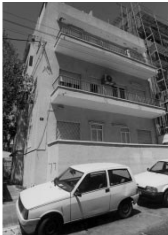
הכתובת האחרונה, הבניין ברחוב בעלי מלאכה

הוא פשוט מקלל: 'מוות בביתך', ואם לא תעשו ככה וככה, תרגיזו את המשיח'. כשאני שומע את הקול שלו, אני טורק את הטלפון. אבל העניין הוא שגם אשתי והילדים לפעמים מרימים הייתה תקופה שהוא הטידיר אותנו מאוד קשה. התלוננתי נגדו במשטרה כמה פעמים, וביקשו שאעשה רישום מוריק. יום-יום הוא התקשר. לפני חודשים זה היה משהו כמו 20 שיחות בחר. דש אבל זה היה חסר טעם, כי גם המשטרה לא מוצאת אותו, אז הפסקתי להתלונן. התברר שאני חלק מרשימה מאוד מוכרבת, ושהוא מטריד שורת רבנים מכל הסוגים, גם פה בכפר.