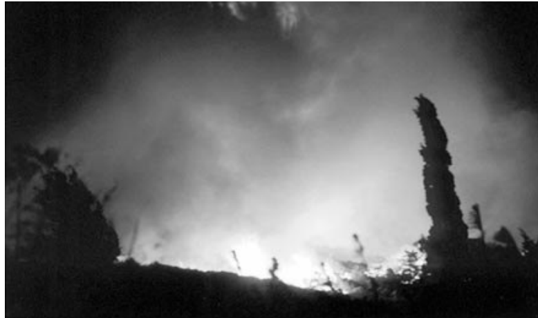
כמה עוד כאלו צמיתו: השריפה בכרמל

יקבל ישראל לא יתנועע? קול ישראל' תמשיך כמו ערוץ 1 שעובר מועדה לוועדה ומדוח לרוח, אבל הם לא יהיו דומיננטיים כמו היום. בסופו של דבר הפרטי ינצח את הממשלתי, כי ההרדה שלי כל יום לסקר הבא זה היתרון שלי על-פני כל מנהל בקול ישראל'. קול ישראל' היא מערכת, שנועדה להרדים אותך ולהנציח אפתיה. ■